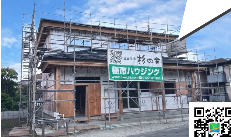
現場：香取市岩ヶ崎台22-11 (グーグルマップ用)