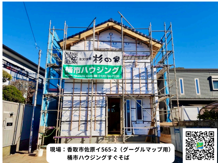
現場：香取市佐原イ565-2（グーグルマップ用） 桶市ハウジングすぐそば